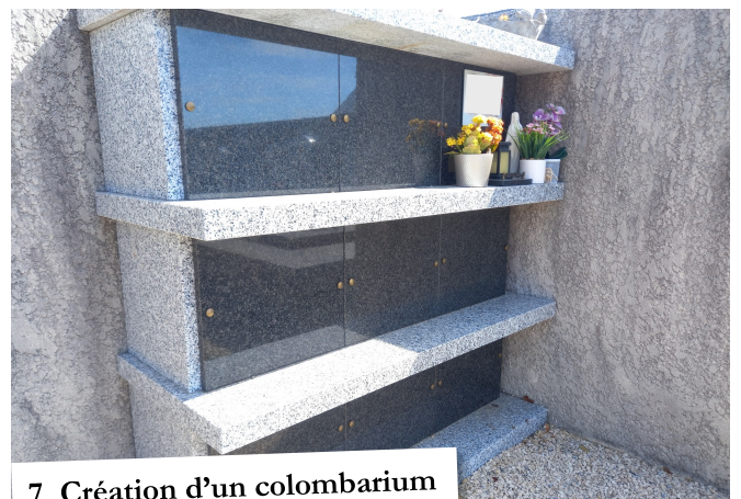
7. Création d'un columbarium