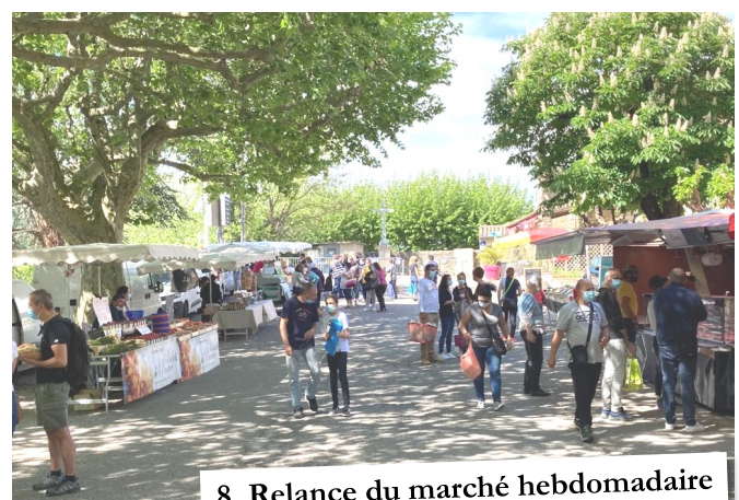
8. Relance du marché hebdomadaire