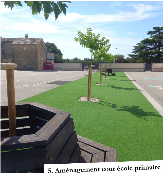
5. Aménagement cour école primaire

5. Les 5 arbres très malades de la cour de l'école primaire ont été arrachés et remplacés par 7 mûriers platanes, leur croissance rapide assurera une grande zone d'ombrage. La pelouse synthétique leur assure un bon drainage, offre un nouvelle aire de jeux pour les enfants et permet de désimpermeabiliser le sol.