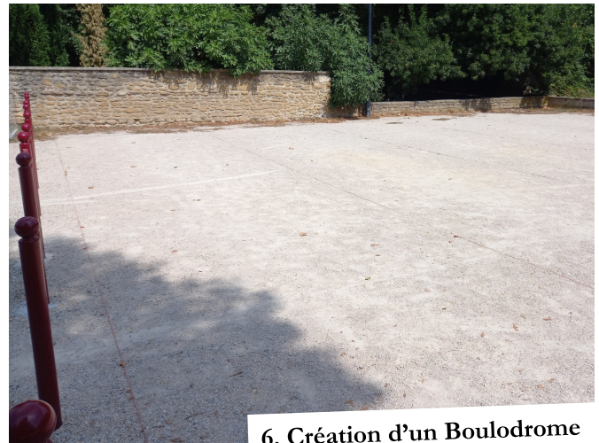
6. Création d'un Boulodrome

8. Début 2021, après des mois de pandémie et de confinement il fallait retrouver ces liens si importants. Ainsi après avoir mis en place un règlement des marchés et de l'espace public c'est le 2 mai 2021 que le marché hebdomadaire du dimanche a vu le jour sur le cours des Lavandières accueillant des producteurs locaux et commerçants.